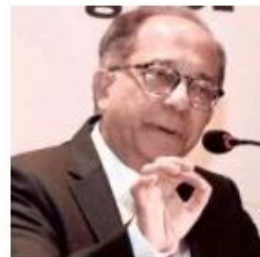
Economist Kaushik Basu

While controlling the economy, it is important to see that we do not try to suppress market forces. "We must never think we can control the invisible hand, stop the market from functioning, halt the eco-