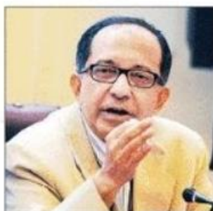
CANDID: Kaushik Basu

India, along with many other emerging economies, has one of the lowest crude mortality rate per million population in the world, he pointed out.