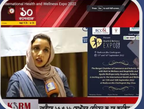
১৫ সেপ্টেম্বর রেডিসন বুর মেজবান হলে স্বাস্থ্য-সুস্থতা মেলা