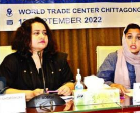
আন্তর্জাতিক স্বাস্থ্য-সুস্থতা মেলা-২০২২ উপলক্ষে আয়োজিত সং-মাঠব্যব