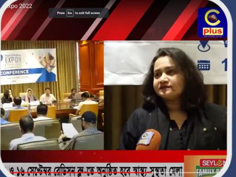
১৫ সেপ্টেম্বর রেডিসন বুর মেজবান হলে স্বাস্থ্য-সুস্থতা মেলা

Healthcare and wellness stakeholders from India, Bangladesh and Malaysia participated in the expo with exhibition stalls and talk shows by doctors and healthcare experts.