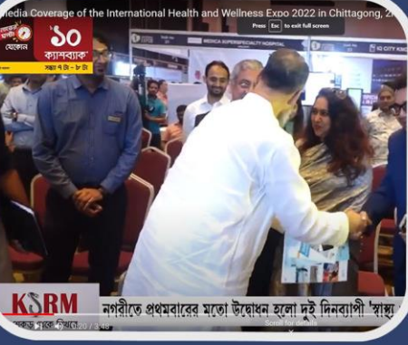
নগরীতে প্রথমবারের মতো উদ্বোধন হলো দুই দিনব্যাপী 'স্বাস্থ্য-সুস্থতা মেলা'