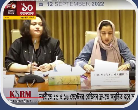
১৫ ও ১৬ সেপ্টেম্বর রেডিসন বুর মেজবান হলে স্বাস্থ্য-সুস্থতা মেলা