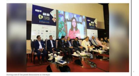
The Bengal Chamber of Commerce and Industry (BCC&I), Kolkata, in collaboration with Mita-1 Wellness and Hospitality, Chittagong and Apollo Hospital, Kolkata, organised a two-day International Health and Wellness Expo in Chittagong on September 15 and 16.

Healthcare and wellness stakeholders from India, Bangladesh and Malaysia participated in the expo with exhibition stalls and talk shows by doctors and healthcare experts.