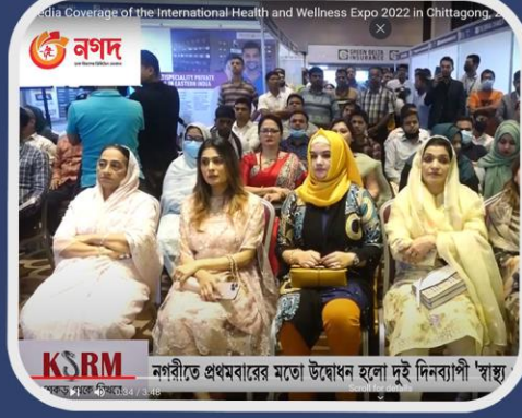
নগরীতে প্রথমবারের মতো উদ্বোধন হলো দুই দিনব্যাপী 'স্বাস্থ্য-সুস্থতা মেলা'