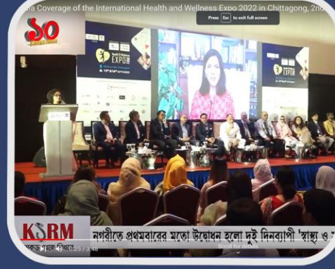
নগরীতে প্রথমবারের মতো উদ্বোধন হলো দুই দিনব্যাপী 'স্বাস্থ্য-সুস্থতা মেলা'

চিকিৎসায় এআই স্বাস্থ্যক্ষেত্রে আধুনিক প্রযুক্তিকে কাজে লাগিয়ে আরও উন্নত পরিষেবা দেওয়া যাবে। আর্টিফিশিয়াল ইন্টেলিজেন্স (এআই) কাজে লাগিয়ে আরও মসৃণভাবে চিকিৎসা করা সম্ভব। এবিষয়ে সচেতনতার প্রসারে দ্য বেঙ্গল চেম্বার অফ কমার্স অ্যান্ড ইন্ডাস্ট্রিতে আয়োজিত হয়