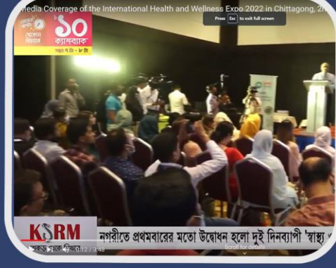
নগরীতে প্রথমবারের মতো উদ্বোধন হলো দুই দিনব্যাপী 'স্বাস্থ্য-সুস্থতা মেলা'