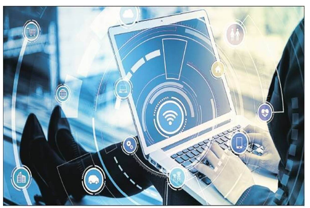
The proposed Silicon Valley Tech Hub in New Town near Kolkata will be a futuristic hub. (Representative image)