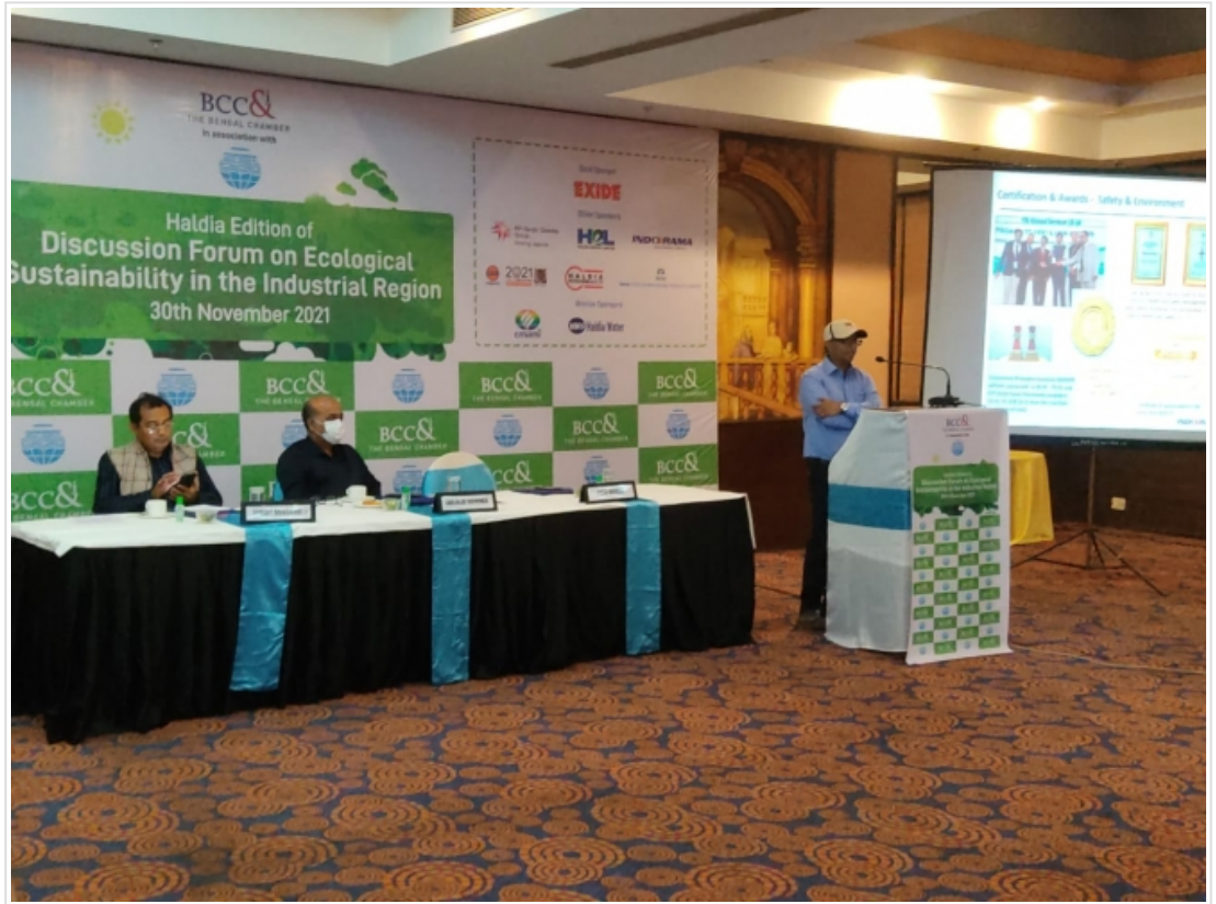
( https://streetbuzz.co.in/newsapp/storage/attachments/1/1638274539748708_large.jpg )