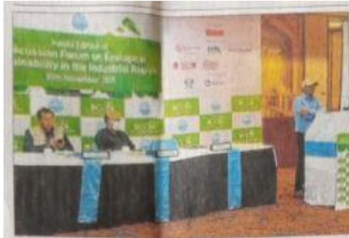
■ হলদিয়ায় শিল্প সংস্থাগুলিকে নিয়ে সেমিনার।